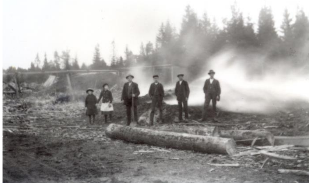
Kolning pågår i Simontorp.