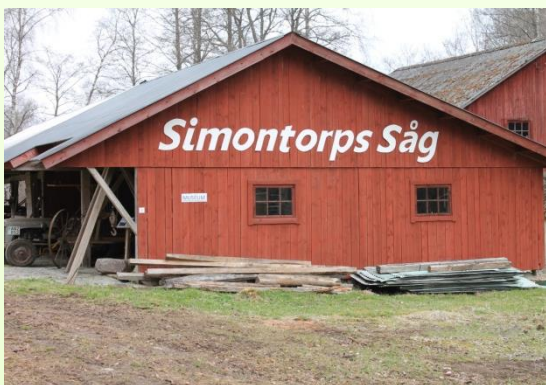
Muséet finns i byggnaden som är märkt Simontorps såg